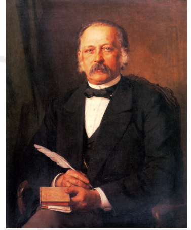
Theodor Fontane. Ölporträt von Carl Breitbach (1883).

Theodor Fontane (1819–1898) verwendete seine Notizbücher etwa 30 Jahre zwischen den 1850er und 1880er Jahren. Sie enthalten unterschiedliche Aufzeichnungen, die entstanden sind während der Ausflüge in die Mark Brandenburg, der Fahrten nach Süd-Deutschland, Schlesien, Italien und in die Schweiz sowie zu den Schlachtfeldern in Dänemark, Böhmen und Frankreich von 1864, 1866 und 1870/71. Fontane beschrieb Kunstwerke, hielt Gespräche von Mitreisenden fest oder exzerpierte Bücher und Inschriften, fertigte Zeichnungen von Friedhöfen, Grabdenkmälern, Kirchen und Schlössern an, skizzierte Übersichtspläne, klebte Kartenmaterial, Hotelquittungen und Zeitungsausschnitte ein und schrieb Vorträge mit. Hinzu kommen seine Notizen als Theaterkritiker sowie Briefkonzepte, Tagebuchaufzeichnungen und Entwürfe zu den Romanen und Gedichten. Fontane verwendete die Notizbücher als Gedächtnisspeicher für unterwegs und nahm sie sich erneut bei der schriftstellerischen Arbeit vor.